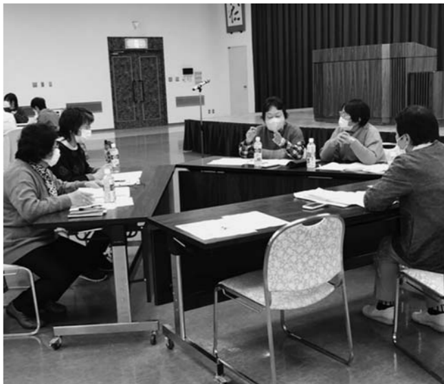
▲4つのグループに分かれ活発に行われた意見交換会