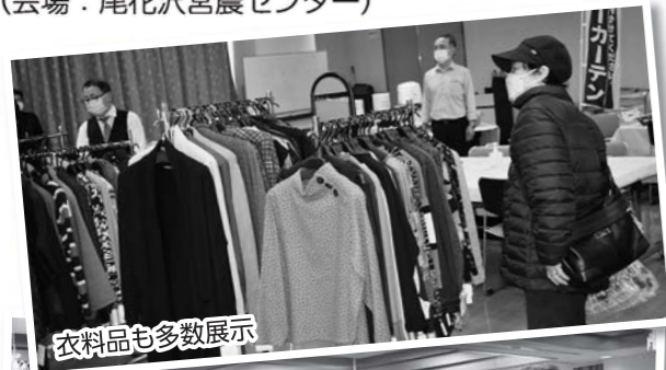
衣料品も多数展示