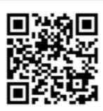
あぐりんの「北村山稲作情報」

◆ いもち病対策 本年は7月中旬からの断続的な降雨により、葉いもちが散見されました。穂いもちに進展すると収量や品質が大きく低下します。いもち病防除は箱施用剤の使用と、穂孕後期と穂揃期の薬剤散布が基本ですが、ほ場を観察し葉いもちの発生がみられた場合には、早期の薬剤防除が必要です。