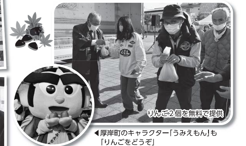
りんご2個を無料で提供