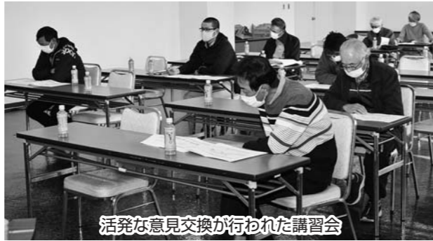
活発な意見交換が行われた講習会

肥料・農業の価格が高騰している中、今後も出向く体制を充実させるとともに、様々な場面で組合員の皆様に情報提供を行い、なお一層、農家手取りの最大化に向けて努めてまいります。