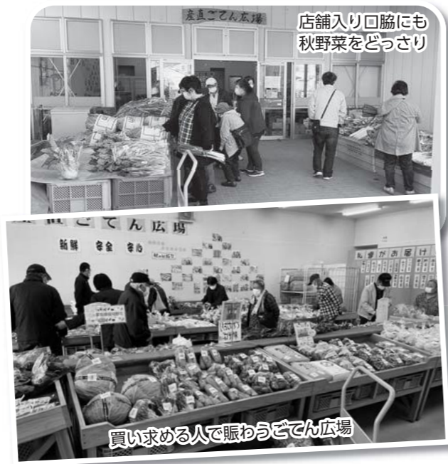
店舗入り口脇にも秋野菜をどっさり

開店と同時に白菜や青菜、ねぎなど秋野菜も特価で販売され、買い求める人で賑わいました。店舗前には屋台コーナーも設けられ、やきとりや「はいからさんのカレーパン」などを販売しました。