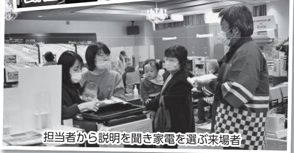
担当者から説明を聞き家電を選ぶ来場者