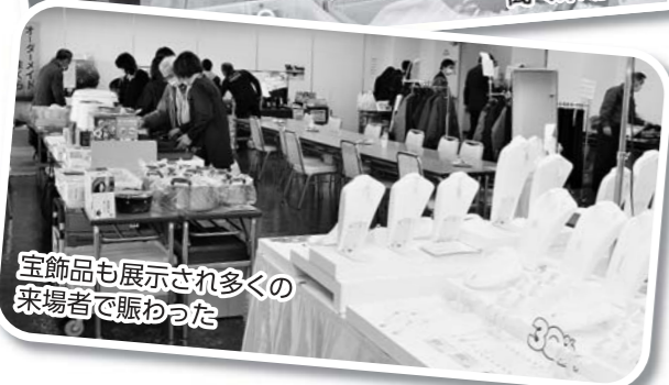
宝飾品も展示され多くの来場者で賑わった