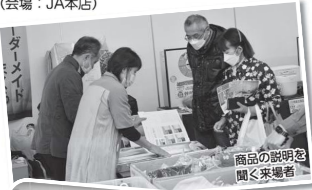
商品の説明を聞く来場者