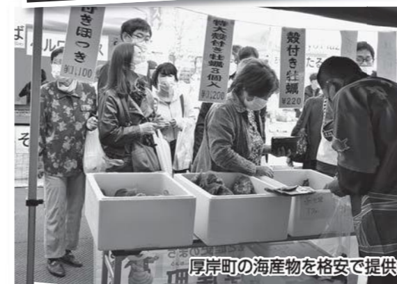
厚岸町の海産物を格安で提供