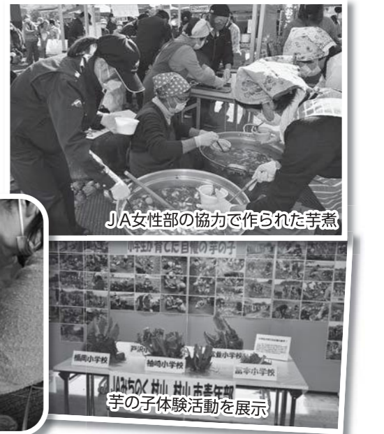
JA女性部の協力で作られた芋煮