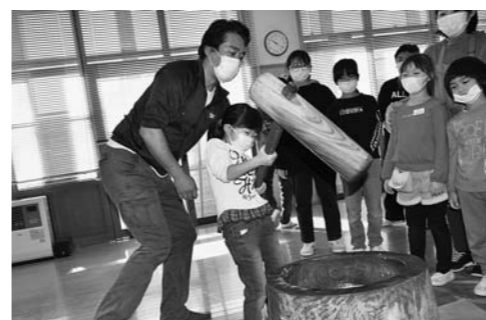
▲杵を持ってもちをつく児童