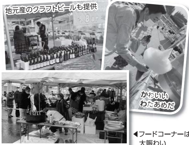
地元産のクラフトビールも提供

15周年を迎えた会場では、尾花沢市細野産のホップとメイプルサップで作った「ほその村クラフトビール」などを販売。フードコーナーでは「いも煮茶屋」がオープンし、尾花沢牛の出来たていも煮が振る舞われました。秋野菜も特価で販売され、東北中央自動車道も開通したとあって、2日間で約3,000人が訪れ賑わいました。