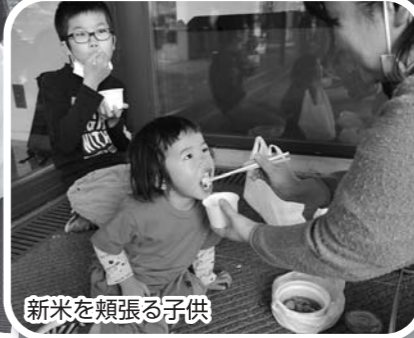
新米を頬張る子供