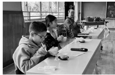
▲自分たちで収穫した「つや姫」を味わう児童たち

尾花沢市立玉野小学校では11月11日、収穫祭を開きました。今年は80kgのもち米を収穫。この日は全校児童65人が、これまで指導してきた尾花沢地区青年部の部員から、もちつきへの注意点を「コッ」を教わり、杵を高く振り上げて「よいしょーよいしょー」の掛け声に合わせてテンポよくもちをつきました。つき上がったものは、雑煮や納豆もちで味わいました。