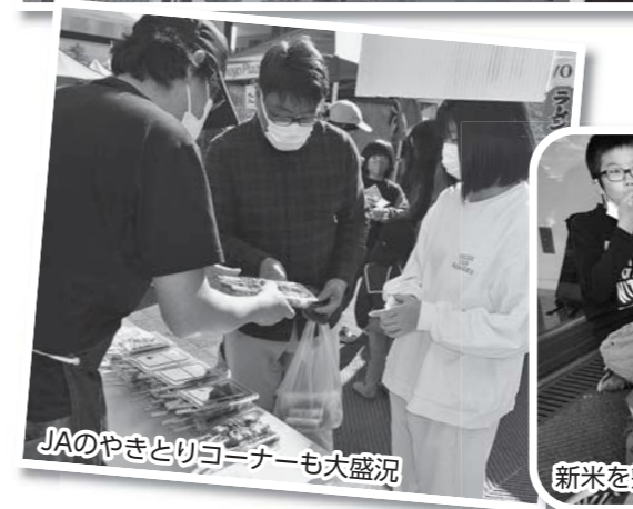
JAのやきとりコーナー也大盛況