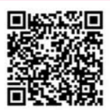
LINEの「北村山稲作情報」