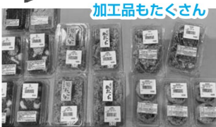
加工品もたくさん