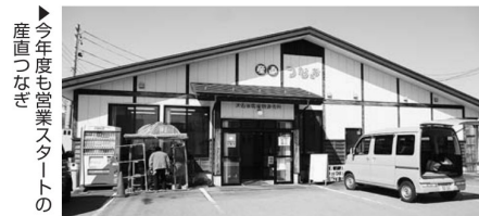
▲今年度も営業スタートの産直つなぎ