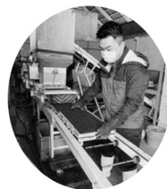
▲播種作業（尾花沢育苗センター）