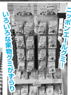
いろいろな果物ソミがずらり