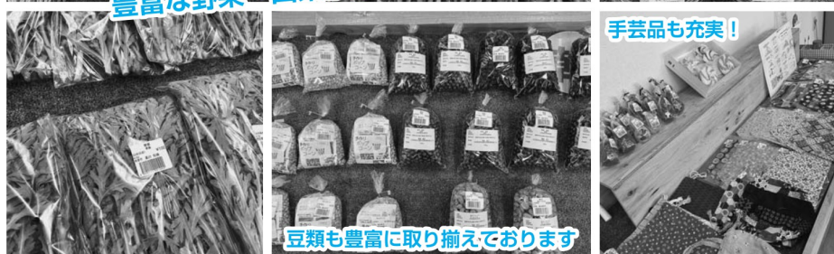
豆類も豊富に取り揃えております