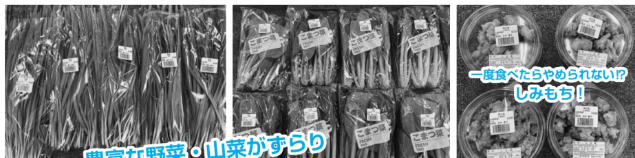
豊富な野菜・山菜がずらり