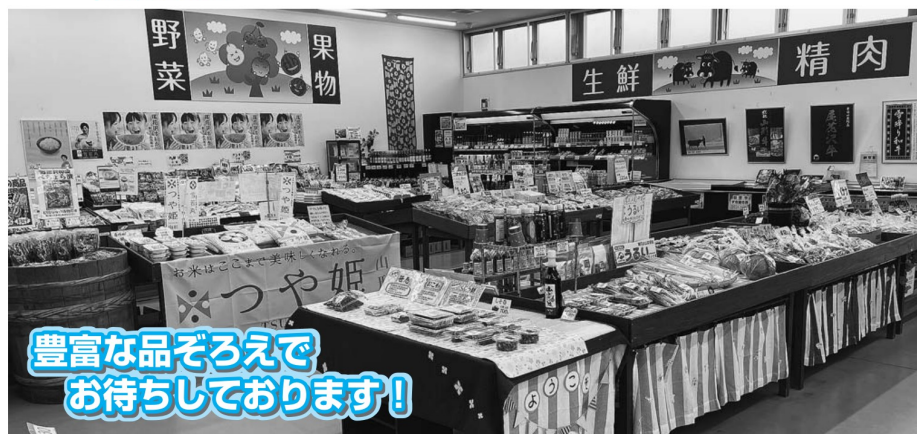
豊富な品ぞろえでお待ちしております!!