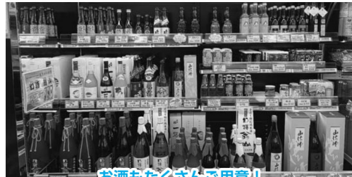
お酒もたくさんで用意!