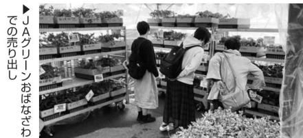
▲JAグリーンおぼなざわでの売り出し

4月29日、30日には、管内のJAグリーン4店舗で春作業応援大売り出しが行われました。肥料、農薬はもとより野菜苗も販売され、また、牛肉など食品も特価で提供されました。