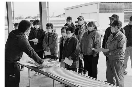
▲JAの担当者から出荷規格などの説明を聞く生産者