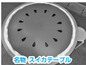
名物 スイカテール