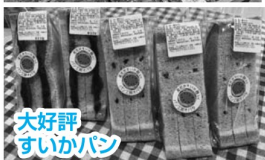
大好評すいかパン