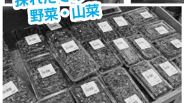
採れたでの野菜・山菜