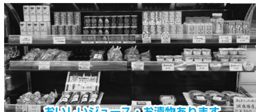
おいしいジュース・お漬物あります

各種グリーン商品券、元気おばね商品券は「はいいと」でご利用できます。有効期限をご確認の上ご利用ください。