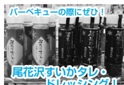
バーベキューの際にぜひ!