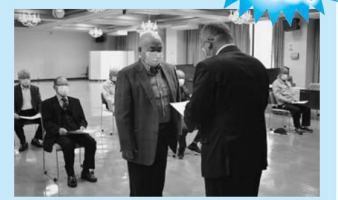
▲委嘱状交付式(尾花沢)

令和4年度の農事実行組合長の皆さんが決まりました。敬称は省略させていただきます。 ◎は代表者、○は副代表者、◎は新任、( )内は農事実行組合名です。