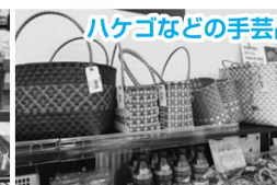
ハケゴなどの手芸品