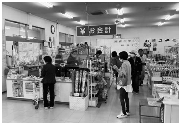
▲多くのお客さまが来店(グリーンごてん)

4月30日から5月2日にかけて、JAグリーン4店舗で農薬や資材、生活用品のセールが行われました。なかでも5月1・2日の山形牛の特価販売は大人気で、オープンから間もなく売り切れる部位もありました。また、この時季の風物詩である野菜苗の販売コーナーも設けられ、多くのお客様が来店しました。