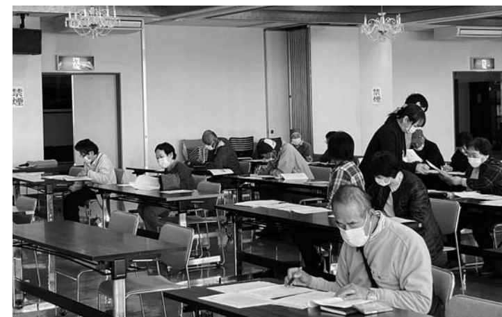
▲研修会に参加した会員たち

食品の製造加工工程において発生する恐れのある「危害」の要因を分析し、発生防止のために講ずべき対策を計画、記録、検証する衛生管理手法のこと。