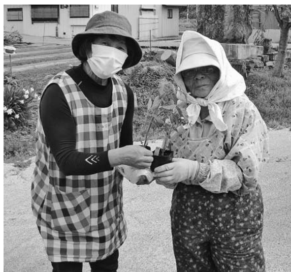
▲支部班長より部員へ

5月上旬、尾花沢地区の全女性部員にミニトマト苗木を配布しました。この活動は、JA女性部の「食と農を支える地産地消運動」の一環として毎年行っています。