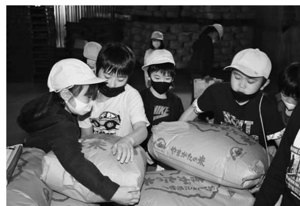
▲お米の重さにビックリ!