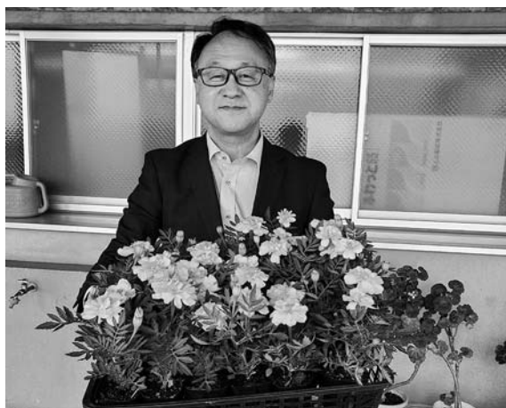
▲大石田南小学校へ贈呈