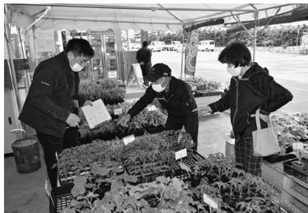
▲野菜苗の販売(グリーンおいしだ)