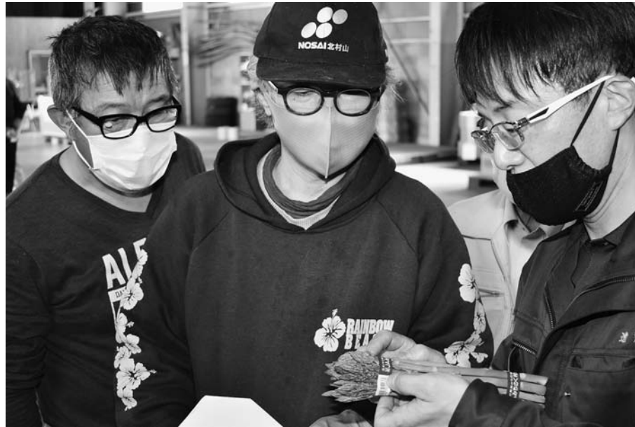
▲サンプルを確認する生産者

5月14日、尾花沢営農センターアスパラガス生産部会は中ノ段集荷場で目ざろえ会を開き、生産者や市場関係者など約25名が参加しました。JA職員が出荷規格や収穫時の注意点などを説明。参加した生産者は出荷規格の見本を手に取り、出荷時の長さや傷、テープの結束位置などを細かく確認しました。