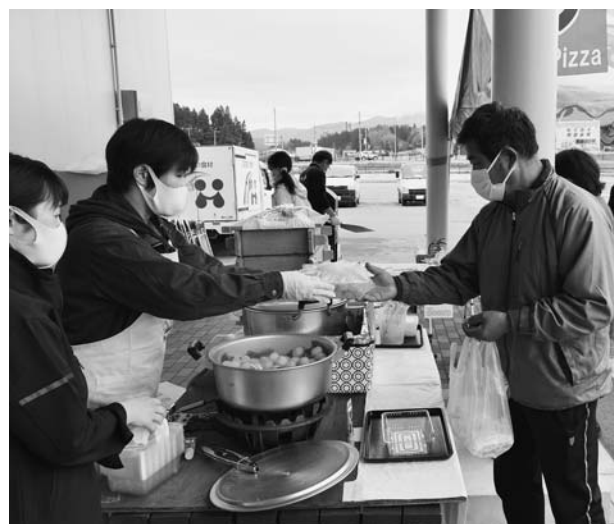
▲大人気の玉こんにゃく