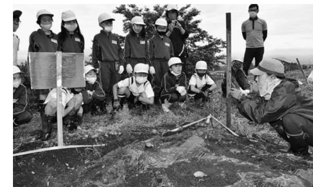
▲盟友の説明を聞く児童たち

5月19日、村山市立戸沢小学校の3年生16名が学校裏の畑でサトイモの定植を行いました。児童たちはJA青年部戸沢支部の盟友に教わりながら実施し、作業が終わった後は今後の管理について質問をしていました。サトイモ総合学習として今後は児童たちが管理作業を続け、秋には大きく育てられたサトイモが収穫されます。