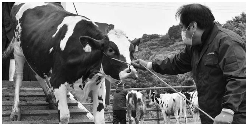
▲トラックから降りる牛

5月27日、尾花沢市の宝栄牧場で入牧式が行われました。当JA管内と、新庄・天童地区の畜産農家から、黒毛和牛とホルスタインあわせて62頭が入牧。健康診断などを経て、広大な草原に放牧されました。10月下旬にはたくましく育ち、農家のもとへ帰っていきます。