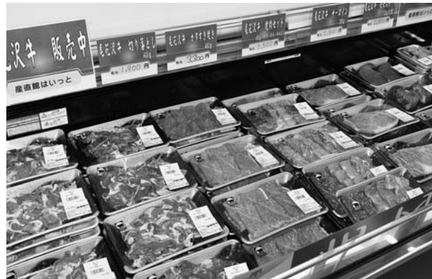
▲陳列された尾花沢牛

JAグリーンおばなざわに隣接する産直館「はいつと」では、5月1日、2日に大売出しを行い、尾花沢牛の販売や、店舗前では尾花沢農産加工の漬物販売と山形名物「玉こんにゃく」をご用意。大盛況でした。