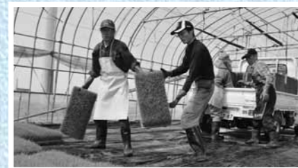
▲苗箱をリレーしてトラックへ(16日、村山中央)