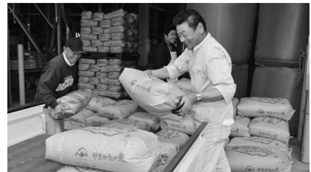
▲農家のトラックへ飯米を積み込み

5月、(株みちのくサービスの暮点給油所で「暮点の日」のイベントが開かれました。「ごでん」の名前にちなみ、5と10のつく5・10・15・25日に、2千円以上の給油をしたお客様へ値引き券をプレゼントしました。