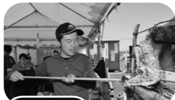
▲「山刀伐ピザ窯」の焼きたてはいかが？