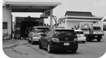
▲にぎわう尾花沢中央給油所