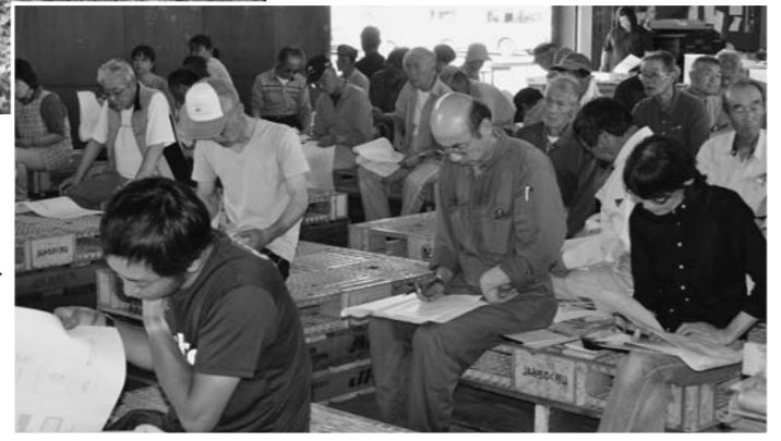
さくらんぼの集出荷が本格的に始まろうとするなか、同生産部の各支部で、出荷打ち合わせ会も開かれました。市場情勢や集出荷の体制を話し合いました。(写真は6月3日、東部さくらんぼ部会の打ち合わせ会の様子)