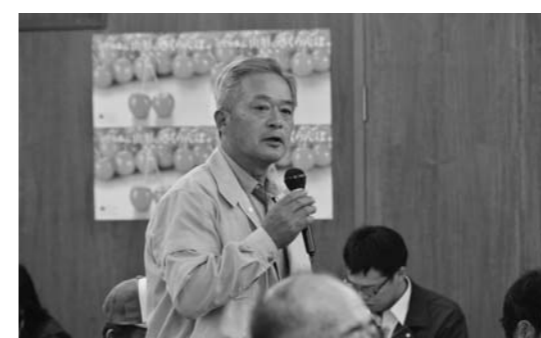
▲活発な質疑応答が行われました▲