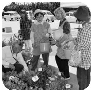
▲花苗の販売コーナー（大石田地区）