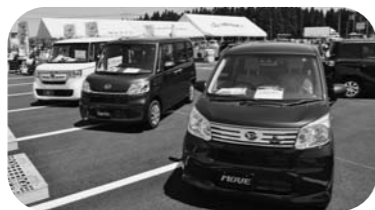
▲尾花沢車両センターの乗用車販売