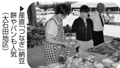
▲産直「つなぎ」納豆餅やパンも人気（大石田地区）