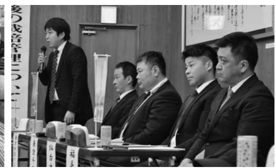
▲出席した市場担当者