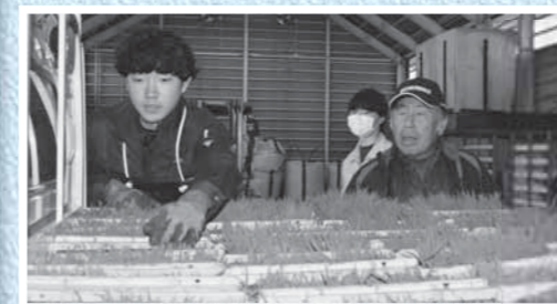
▲きちんと枚数を確認(19日、尾花沢)

J Aみちのく村山管内の、村山中央、葉山、戸沢、尾花沢、大石田の5つの育苗センターで、5月中旬から水稻苗の引き渡しが行われました。いずれのセンターも、ピークの時期には早朝から農家のトラックが並び、職員によって鮮やかな緑色の苗が次々に積み込まれました。