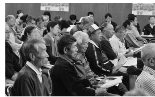
▲さくらんぼ生産者も集結