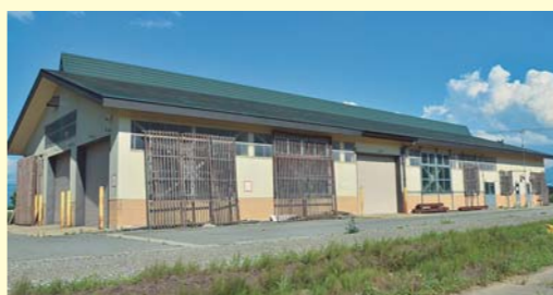
大石田育苗センター