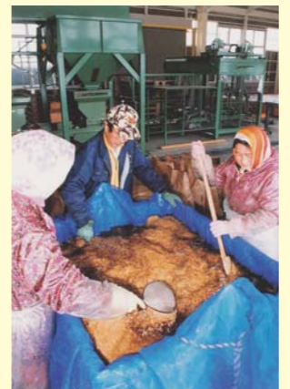
平成10年当時の塩水選作業の様子。発芽の揃いをよくし、ばか苗を予防します。

5月の田植え期、当JA管内のそれぞれの育苗施設で苗が配布されました。これらの施設のうち、大石田町豊田地区の「大石田育苗センター」が整備されたのは平成10年。今からちょうど20年前です。かつては同町の来迎寺地区で行われていた育苗作業が、JAみちのく村山の合併誕生後はこちらの施設で行われています。初稼働時の様子は、当時の「ふれあい」でも紹介されました。 同施設は「豊田グリーンファーム」が主体となって運営しています。農業を使わない温湯消毒にも10年前から取り組んでおり、町の稲作政策に対応しながら、「つや姫」をはじめとする特裁米づくりを強みにバックアップ。地域の米農家にとって頼りになる存在です。平成30年度の苗の引き渡しも6月上旬に終了しました。地域の米づくりが今年もここからスタートです。