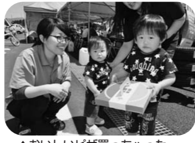
▲おいしいピザ買った～