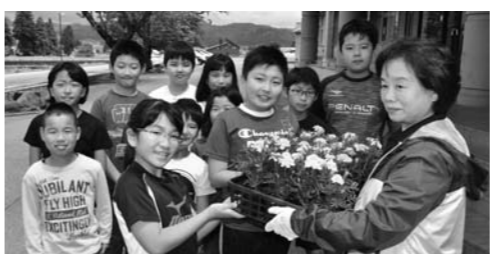
▲11人の生活委員の皆さんへ花苗を手渡し。この後みんなで植えました

大石田地区女性部による「花いっぱい運動」。地域の学校を花で飾ろうと、毎年大石田町の各小中学校に花苗を提供しています。大石田南小学校では、女性部員から児童代表に花苗を贈呈しました。