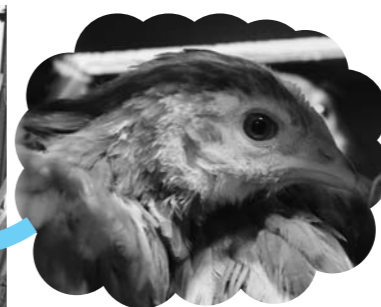
▲どこへ運ばれていくのかな？

ピヨピヨ ひな鳥をお届け 5月9日、当JA管内の3つの経済事業所で、ひな鳥の配達と引き渡しが行われました。養鶏している農家に、毎年この時期に「ボリスブラウン」「岡崎おとほん」「名古屋コーチン」の3種類が届きます。管内の約30件の農家に配達されました。