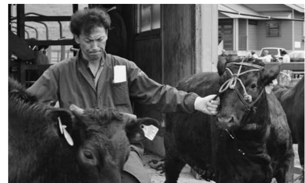
▲元気な「べご」たちを巧みに誘導

4月27日に大高根事務所で、また5月1・2日に村山市中央カントリーエレベーター(以下CE)で、飯米渡しが行われました。それぞれのCE利用者を対象に実施しているもので、今回は春渡し分として申し込まれていた数量が引き取られていきました。CEの飯米は低温倉庫での保管も行っており、利用者からは「一年を通して美味しいお米が食べられる」と好評をいただいています。