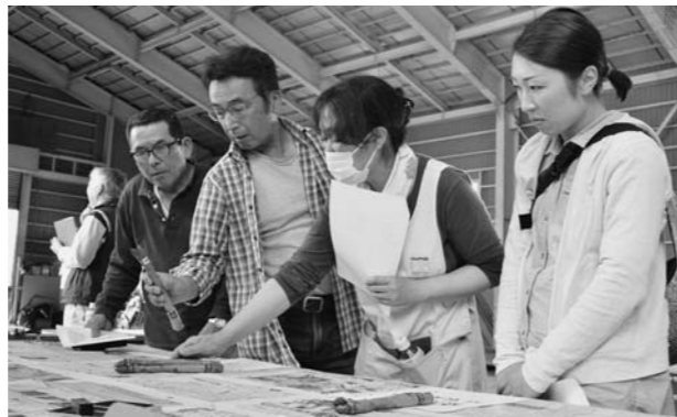
▲出荷規格を部会員同士で確認

50周年目の総会、部長もパトロンタッチ 5月12日、尾花沢営農センターすいか生産部会は第49回通常総会を開きました。組織設立から50周年を迎えた同部会。今年