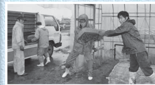
▲雨のなかの引き渡し(17日、大石田)