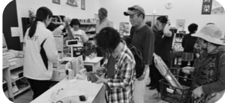
▲にぎわう産直館「はいっと」