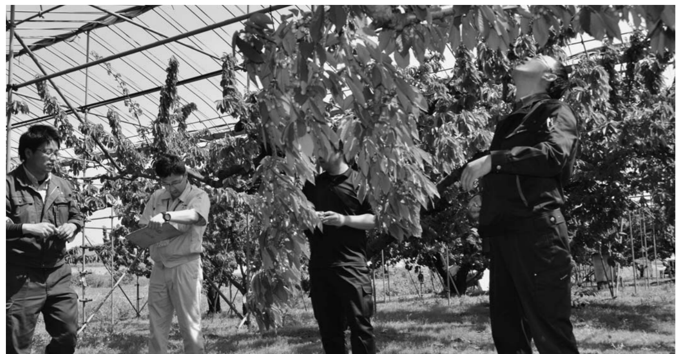
▲5月21日の作柄調査(写真は西郷地区)