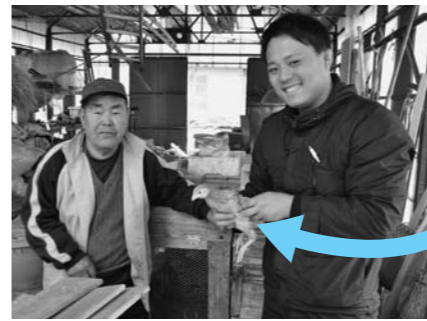
▲村山市の岩野地区でした！ピヨヨ