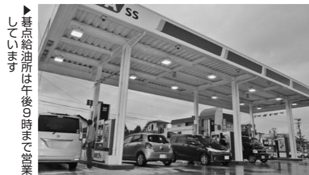
▶暮点給油所は午後9時まで営業 つづきます