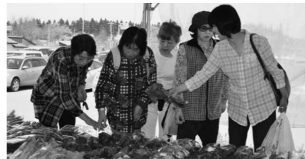
▲どっさりの山菜にびっくり(6日)

ピヨピヨ ひな鳥をお届け 5月9日、当JA管内の3つの経済事業所で、ひな鳥の配達と引き渡しが行われました。養鶏している農家に、毎年この時期に「ボリスブラウン」「岡崎おとほん」「名古屋コーチン」の3種類が届きます。管内の約30件の農家に配達されました。