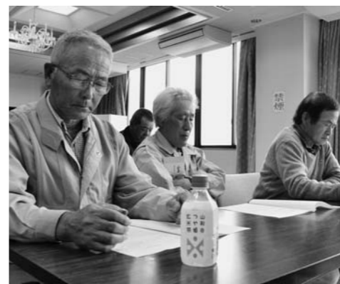
▲総会に出席した部会員