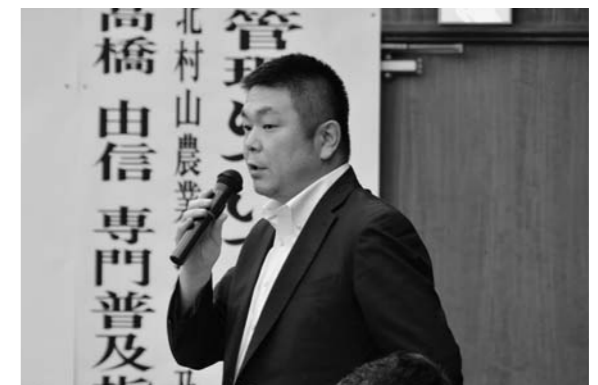
▲質疑応答で、市場関係者が回答