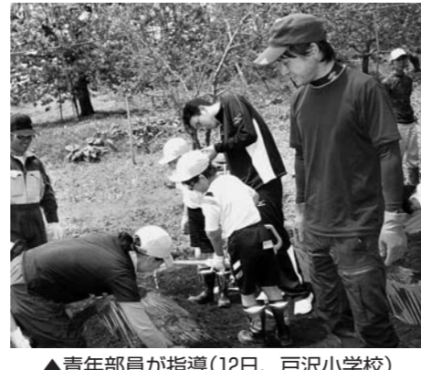
▲青年部員が指導(12日、戸沢小学校)