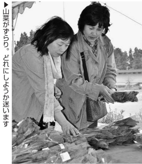
▲山菜がすりすり。どれにしようか迷います

尾花沢市の道の駅「花笠の里ねまる」は5月6・7・13・14日の4日間、「春の山菜やま盛りまつり」を行いました。「コミ・ウルイ・タラノメなどが販売台に並び、大勢の旅行者などが購入。直売出荷生産部会のメンバーが山菜アドバイザーとして売り場に立ち、調理法や保存方法を説明しました。 7日は、千円以上お買い上げのお客さんに花の苗をプレゼント。14日には山菜をふんだんに使った山菜汁を販売し、また山菜まつりの期間を通して「尾花沢こだわり冷麺」の試食販売も行いました。