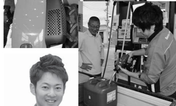
▲心をこめて給油 (26日、尾花沢中央SS)