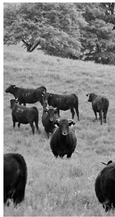
▲草原に放たれてご満悦!の牛たち