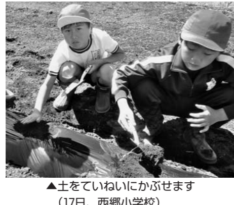
▲土をていねいにかぶせます (17日、西郷小学校)