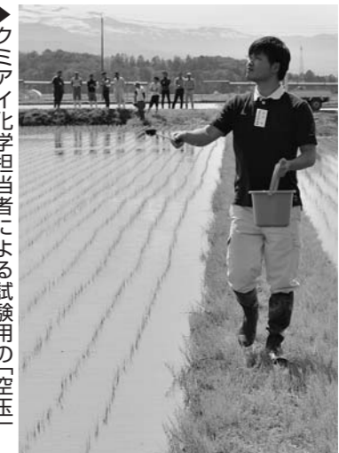
▲クミアイ化学担当者による試験用の空玉を使った実演

尾花沢経済事業所は5月29日、クミアイ化学が取り扱う「豆つぶ」除草剤の散布実演会を開催。「豆つぶ」は固形の粒の形をしており、既存の剤型と比べ半分以下の時間で作業が可能とされ、成分も田全体に広がりやすい製品です。クミアイ化学の担当者が実演し、参加した稲作農家にその利点を説明しました。