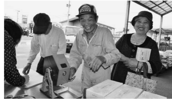
▲盛り上がる抽選会場(27日、尾花沢)

田植え作業が一息つく5月下旬の「さなぶり」の時期にあわせて、尾花沢・大石田管内で各種イベントが行われました。26・27日には、JAグリーンおばなざわ前の会場で抽選会を開催。尾花沢牛肉まんや焼き鳥、花の苗なども販売しました。