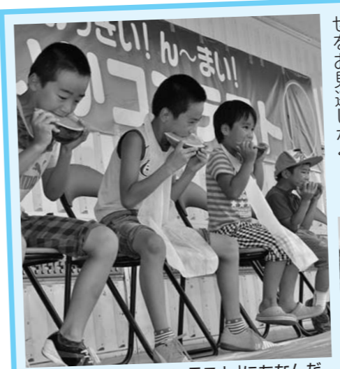
▲「尾花沢すいかコンテスト」にちなんだイベント(去年7月の様子)

尾花沢市の道の駅「花笠の里ねまる」は、「今年でオープン10周年を迎えました。平成19年にオープンして以来、山菜まつり、「特産尾花沢すいか」の直売、秋の収穫感謝祭、冬の鍋まつりと、一年を通して各種イベントを実施し、尾花沢内外の方から親しまれてきた「ねまる」。今年度の夏には記念イベントを開催予定です。来月号の「ふれあい」のお知らせをお見逃しなく!