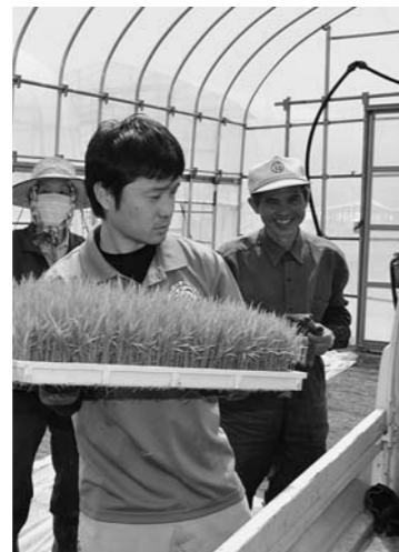
▲暑いハウス内で、苗箱を運びました(20日、尾花沢地区)

当JA管内の5つの育苗センターで、5月中旬から下旬にかけて、水稻苗の引き渡しが行われました。特に好天に恵まれた週末は、各センターに早朝からトラックが列をなしました。苗を受け取りに来た農家は、「今年は融雪の遅れと5月の寒さが少し影響した。農作業は、少し遅れているところと、平年並みに追いついたところがあるようだ」と話していました。