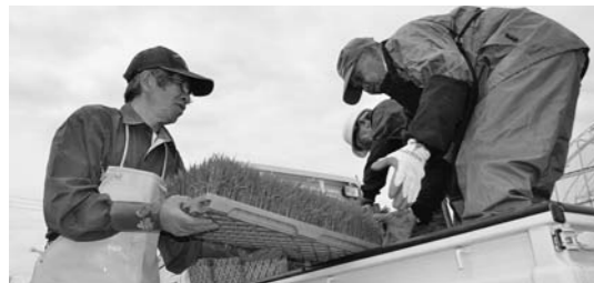
▲今年は話題の「山形95号」も取り扱われています(15日、村山地区)

健康サロンが 本店敷地内にオープン 当JAの本店の敷地内に、5月15日から無料の健康サロンがオープンしています。ここで行われている「交流磁気治療」は、磁力で体内の血流をよくし、自律神経の改善を促す治療法。磁石入りのマットを椅子に敷き、そこに座ることで治療を行います。 オープン以来、多くの人が訪れて効果を体感。初日から訪れたという女性は、「この健康サロンは榊岡支店にあった時から利用している。下半身の調子が良くなり、杖を使わずに歩けるようになった」と話しました。 営業時間は午前10時～午後5時半。土日祝日は休みです。