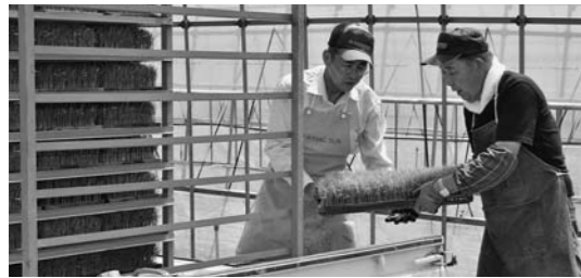
▲農家組合員のトラックへ積み込み(20日、大石田地区)

当JA管内の5つの育苗センターで、5月中旬から下旬にかけて、水稻苗の引き渡しが行われました。特に好天に恵まれた週末は、各センターに早朝からトラックが列をなしました。苗を受け取りに来た農家は、「今年は融雪の遅れと5月の寒さが少し影響した。農作業は、少し遅れているところと、平年並みに追いついたところがあるようだ」と話していました。