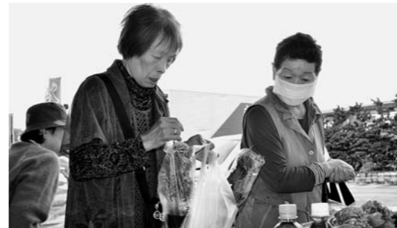
▲「つなぎ」の出張販売で野菜を購入(27日、大石田)

また同日、JAグリーンおおいしだでもさなぶりセールを実施。来店者に玉こんにゃくがふるまわれ、肥料や食品、野菜苗を特価で販売。産直「つなぎ」の出張販売ではたくさんの野菜や山菜が並び、特にアスパラガスは大人気でした。