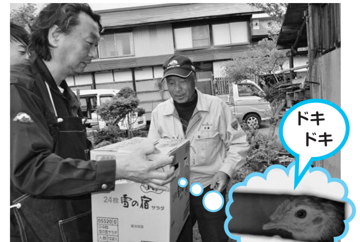
▲ひな鳥の入った箱を配達

5月11日、管内の3つの経済事業所で、ひな鳥の配達と引き渡しが行われました。毎年この時期に、飼料と一緒に「ポリスブラウン」「岡崎おうはん」「名古屋コーチン」の3種類をお届けしています。管内の約30件の農家に配達されました。