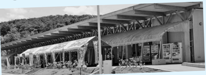
▲オープン10周年を迎えた「ねまる」