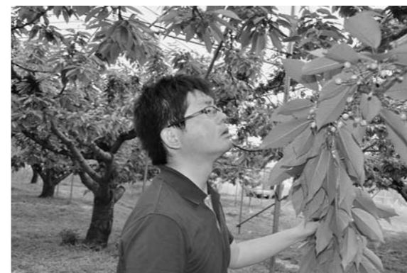
▲24日には作況調査も行われました

と述べました。 続けて、平成29年度の生食向さくらんぼの販売基本方針として、消費宣伝の展開・早期出荷・良品質生産などの重点事項を確認。市場関係者からは「さくらんぼの販売は短期決戦。6月の出荷ウェイトを上げ、いかに早く出荷するかがポイントになる。一粒残らず出荷を」と要望が出ました。生産者からも、今年の販売計画や、品種ごとの需要について質問が出ました。 最後は生産者・市場担当者・JA代表の3人がステージに立ち、「ガンバリ」を力強く三唱して大会を締めくくりました。