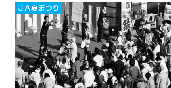
JA夏まつり 6月28日に大石田、7月5日に尾花沢でJA夏まつりが開催されました。おたのしみ抽選会や地元園児によるパフォーマンスも行われ、両会場とも多くの組合員や地域の方々で賑わいました。