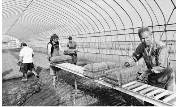
▲水稲苗の積み込み作業(大石田育苗センター)

どの施設も、ピークの時期には早朝から農家のトラックの行列ができ、従業員や職員によって次々に積み込まれました。