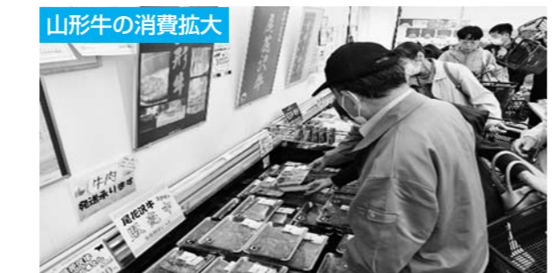
山形牛の消費拡大 おばね産直館「はいっと」では、様々なイベント時だけではなく、1年をとおして山形牛の販売をおこない、消費拡大に取り組んでいます。

当JAは組合員との徹底した対話に基づいて「農業者の所得増大」「農業生産の拡大」「地域の活性化」を基本目標とする創造的自己改革の実践に取り組んでおります。