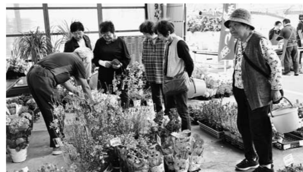
▲さなぶりに合わせて開かれた祭り