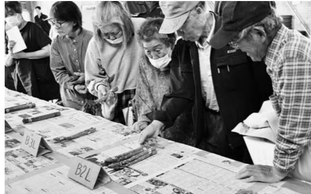
▲出荷規格を再確認する生産者たち

JA職員が出荷規格や収穫時の注意点などを説明。参加した生産者は出荷規格の見本を手に取り、傷や穂の開き、結束テープの位置などを細かく確認しました。