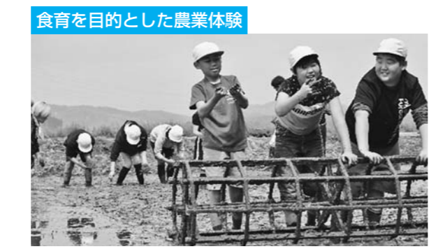
食育教育を目的とし、子供たちに土のふれあいから自然や農業の大切さ、食と農のかかわりを学んでもらおうと、青年部・女性部の協力を得て、年間をとおしてその支援活動に取り組んでいます。