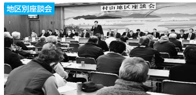
2月25日、2月26日の2日間、管内3地区で座談会を開催。様々な機会でご頂いたご意見、ご要望は十分な検討を重ね、今後のJA事業運営に反映させていただきます。

また、全事業を対象とした「みちのく村山プログラム」の開催で事業計画・自己改革の取り組みの進捗状況を確認し確実に実践していき、事業の抜本的な見直し・検討も含め、直接販売事業の強化と生産性の向上、施設の経営効率化に取り組み、さらなる事業の発展をめざしてまいります。