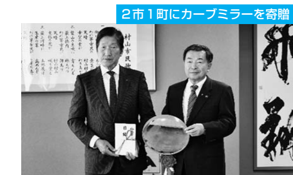
2市1町にカーブミラーを寄贈 当JAとJA共済連山形は、令和7年度2市1町に16基のカーブミラーを寄贈しました。昭和48年から累計で1,137基になります。