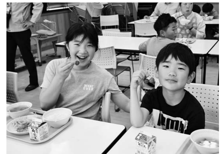
▲大粒の加温さくらんぼに笑顔の児童

村山市立大久保小学校の給食に5月15日、地元農家が作った加温さくらんぼが登場。全児童48人がひと足早い初夏の味を楽しみました。