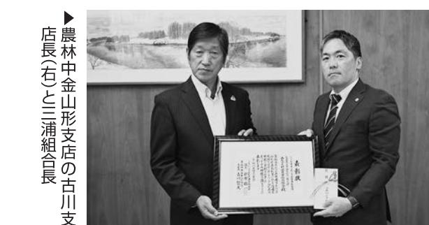
▶ 農林中央金庫山形支店の古川支店長(右)と三浦組合長