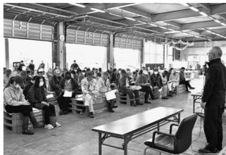
▲出荷打ち合わせ会(果実選果場)

あいさつにつづき、協議ではJAの担当者から、18日に実施した作況調査の結果、地域や園地によってばらつきがあり、管内平均して「昨年よりは良いものの『豊作』とまではいかない」結果となったことが報告されました。販売基本方針では、「重点市場等との販売状況等の情報共有及び計画出荷による価格の維持」など3つの方針が示されました。市場の担当者からは、消費地の情勢や販売方針について報告があり、「有利販売には良品質出荷を基本に、出荷数量などの情報共有が重要である」と話し、活発に意見交換が行われました。