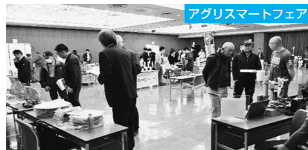
最新の農業資材を一覧に展示するアグリスマートフェアを11月1日にJA本店で開催しました。省力化肥料、農薬、資材等の展示や、気象対策・省力化をテーマにした講習会もおこない、コスト軽減につながる対策に取り組んでいます。