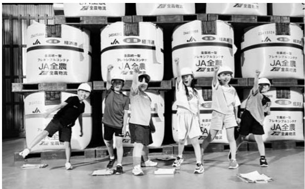
▲雪室を見学した大久保小の児童

学校給食にも「雪室米」が使用されていて、児童たちからは「雪室の中の米は何種類あるのか」、「米はどこに販売されているのか」など多くの質問が出されました。