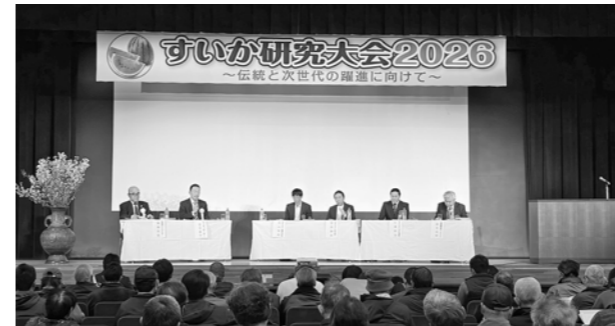
▲活発に意見交換が行われたパネルディスカッション

パネルディスカッションでは、村山・尾花沢・大石田のすいか生産者3人から、高温期における栽培上の課題、若手生産者の育成等についての意見が出され、今後の取組みなどについて意見交換が行われました。