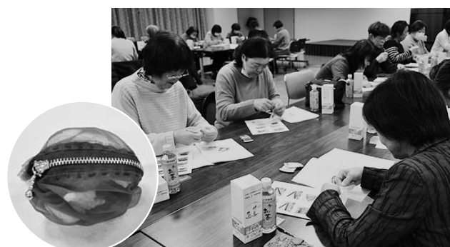
▲キャンディーポーチ作りに挑戦

報告会終了後、貸衣裳の古いドレスを利用したキャンディーポーチ作りに挑戦。参加者は事務局の説明を聞きながら作り、貸衣裳の生地を再利用したオリジナルのポーチに満足していました。