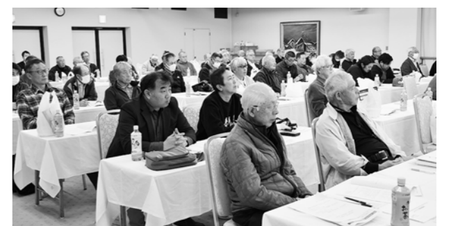
▲良食味安定生産に向け取り組むことを確認した総会