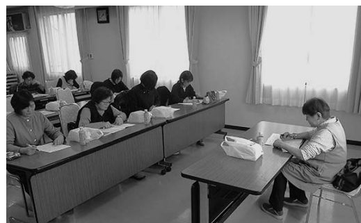
▲来年度も活発に活動していくことを確認した総会

令和8年度は、大石田地区の小中学校に花苗をプレゼントする花いっぱい運動、生活資材などの共同購入、JAまつりへの参加、手芸教室、フードドライブ活動など積極的に活動し、仲間づくり運動を強化していくことを確認しました。